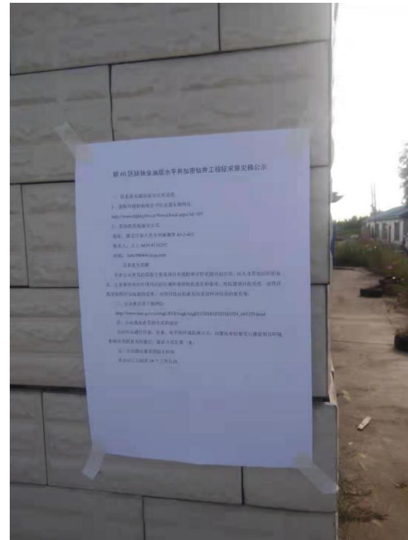
朝阳屯张贴公告照片