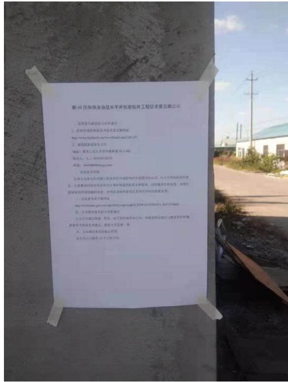
东哈达沟张贴公告照片