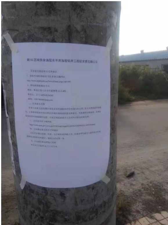
栾仁贵屯张贴公告照片