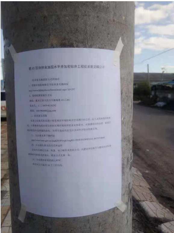
薛宜峰屯张贴公告照片