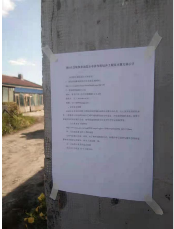
二站刘屯张贴公告照片