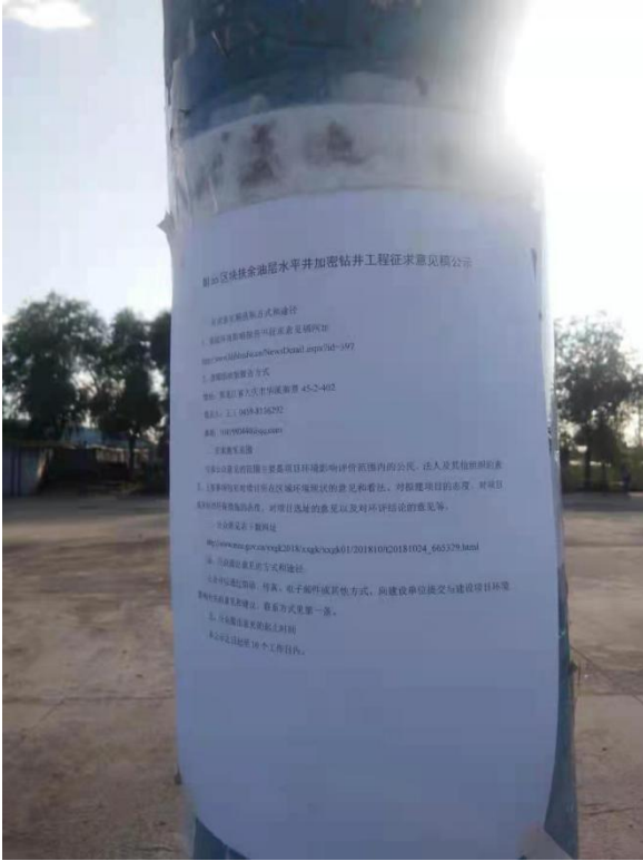
三合屯张贴公告照片