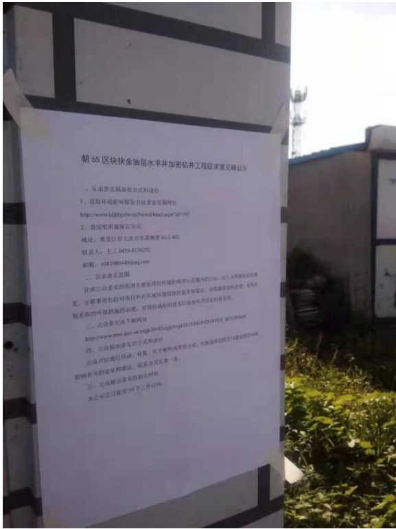
西哈达沟张贴公告照片