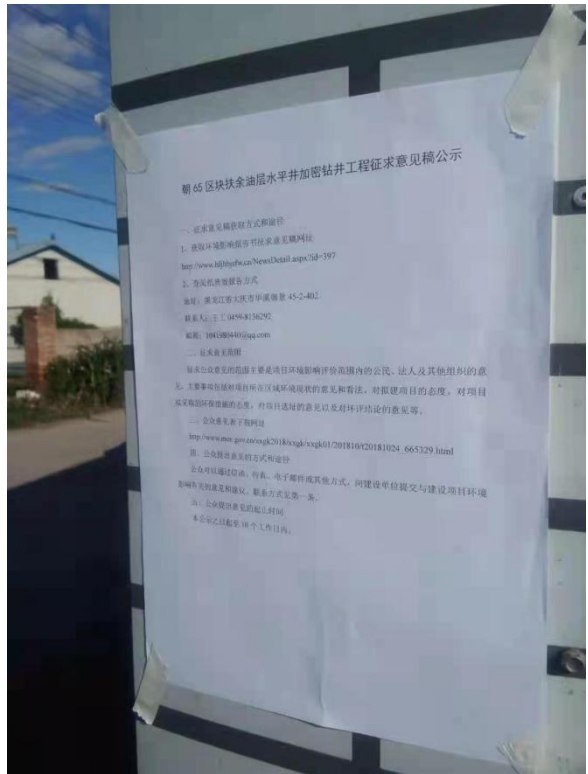
任天福屯张贴公告照片