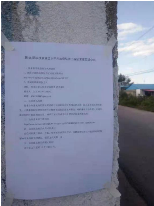
前怀家张贴公告照片