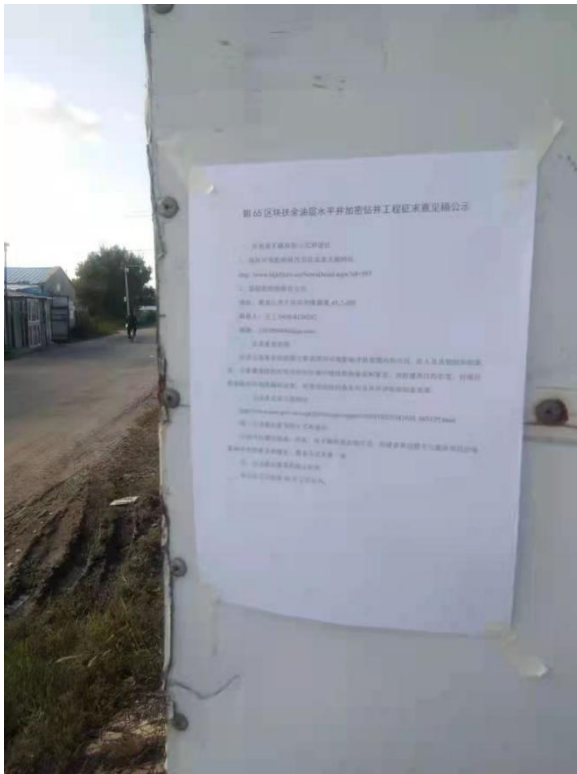
郑旺屯张贴公告照片