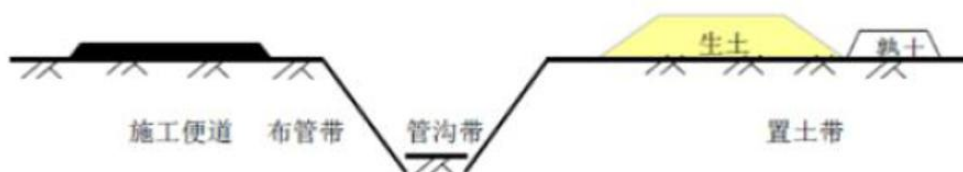
图 3-4-11 管道施工平面布置图

在场地清理过程中，施工带范围内的土壤、植被和农作物都将受到扰动和破坏，不过其造成的影响仅局限在施工带宽度的范围内。管道施工平面布置图见图3-4-11。