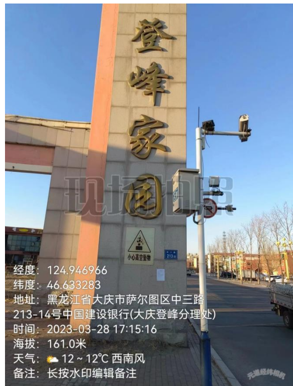
登峰家园张贴公告照片