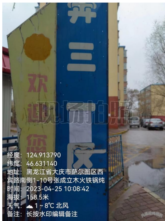
奔三村张贴公告照片