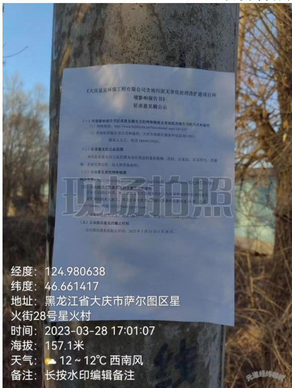
奋勇村张贴公告照片

经度: 124.980638 纬度: 46.661417 地址: 黑龙江省大庆市萨尔图区星 火街28号星火村 时间: 2023-03-28 17:01:07 海拔: 157.1米 天气: 🌤️ 12 ~ 12°C 西南风 备注: 长按水印编辑备注