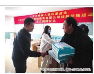
爱心人士捐赠物资,助力困难群体生活。

记者在采访中了解到,作为肇州县的招商引资项目,黑龙江和泽生物科技有限公司年10万吨有机(类)肥项目落地融入了省级重点项目服务,开辟绿色通道,实行全流程专班推进,帮助办理前期手续。从开工到入伙,从建设到建成投产,全程“保姆式”服务,促进项目建设起步即冲刺,开干即决战。与此同时,县委或镇主要领导定期赴建设工地现场办公,帮助解决了项目建设过程中出现的建设用地、技术人员闭环入场等问题。 “肇州经济开发区为我们创造了最优的服务环境,设置专人定点对接。近日,还协助统计部门走进企业进行数据审核、现场核查,协助企业入规入统。目前,相关手续已由县统计局上报到国家平台。”黑龙江和泽生物科技有限公司相关负责人说,在良好的营商环境下,在深入了解企业区位优势、产业基础扎实、后续发展潜力等优势后,公司于2022年6月与肇州县政府签订了20万吨/年生物肥料二期项目,并启动将在乡村振兴、光伏发电、食品加工、冷链物流等领域继续开展合作潜力,不断拓宽合作领域,携手为肇州县产业振兴发展助力。