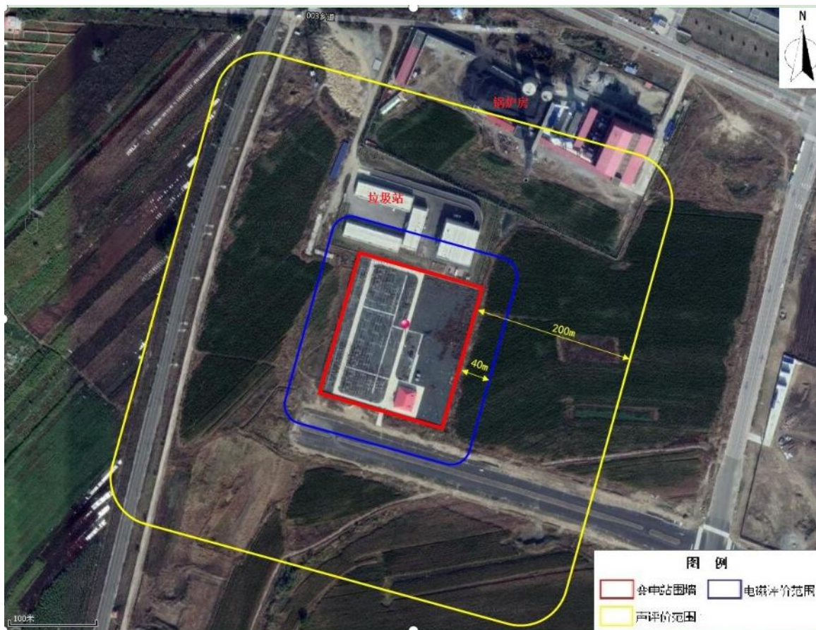
图 2-1 本项目周边关系示意图

域内没有国家、省、市级自然保护区，周围无危险建筑，不压覆矿床和文物，无珍稀濒危物种。环西变电站北侧紧邻垃圾站，北侧约 100m 为调峰锅炉房，东侧、西侧、南侧均为空地，环西变电站场界 200m 内无居民区，项目不涉及生态保护红线。本项目无环境保护目标。见图 2-1。