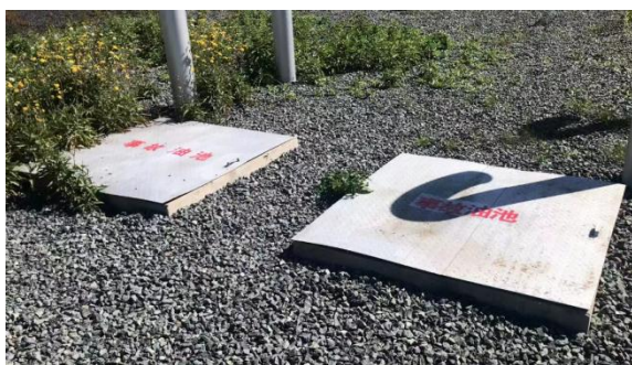
事故油池现状及标识照片