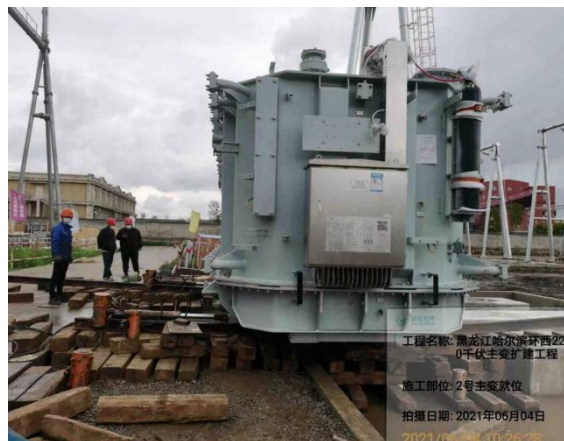
本次拆除主变施工照片