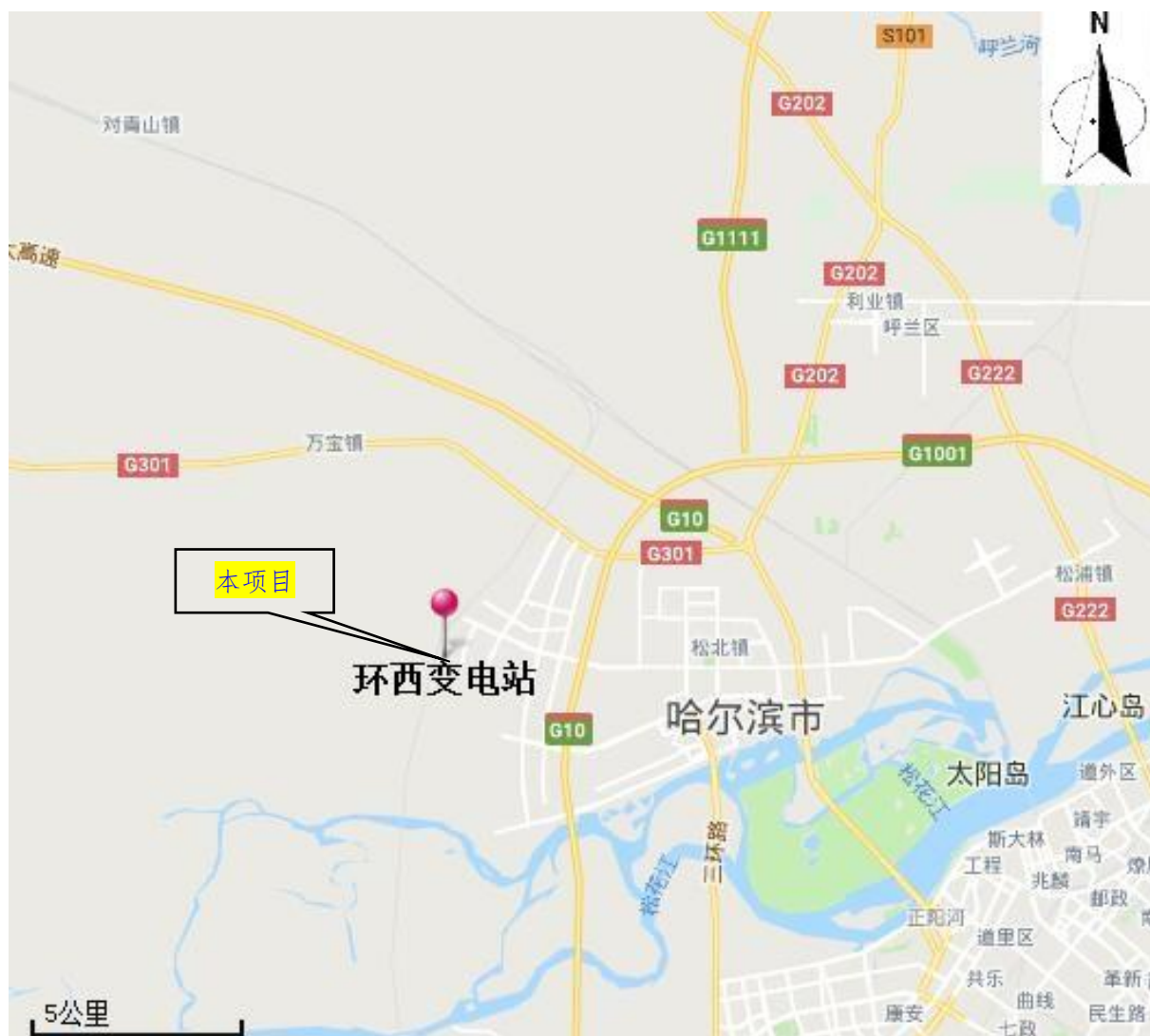
图 4-1 工程地理位置图

本项目位于黑龙江省哈尔滨市松北区环西变电站站内，变电站工程在原址征地范围内进行，不新增占地。地理位置见图 4-1。