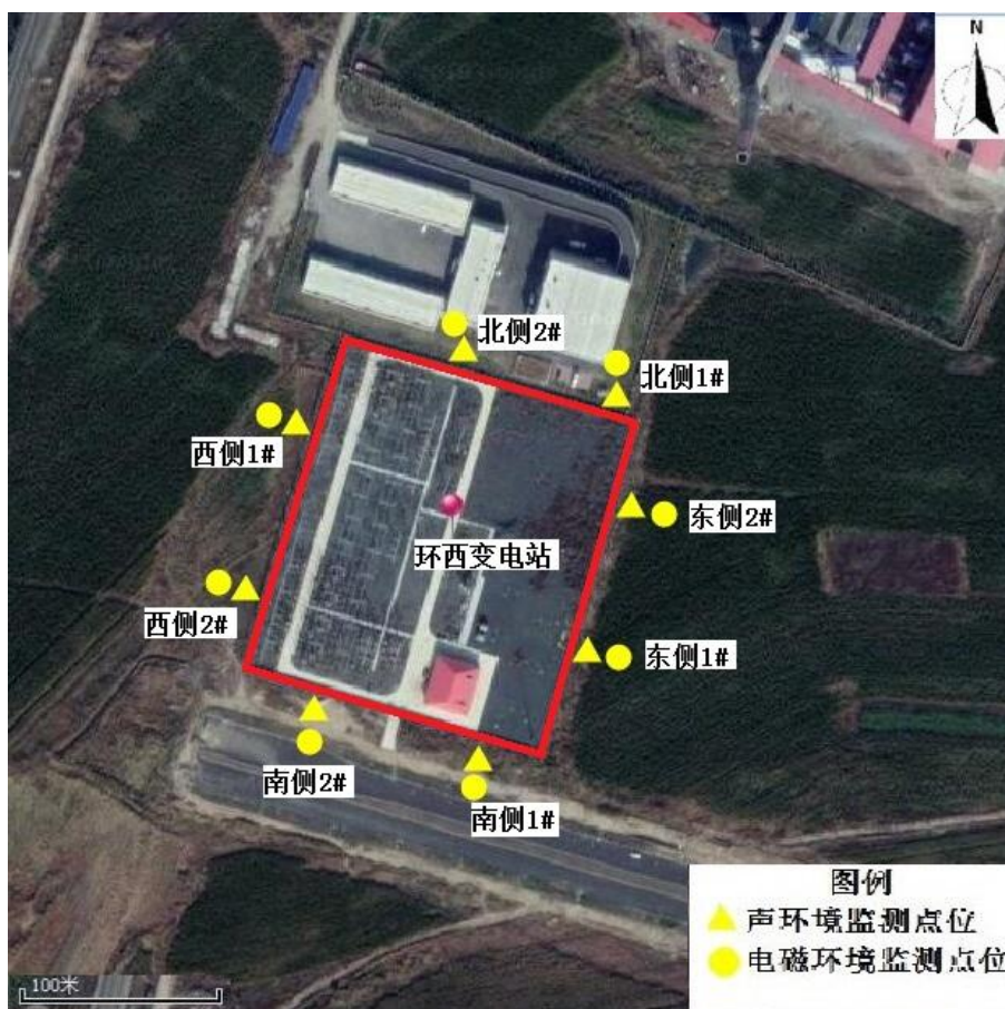
图 7-1 220kV 变电站监测点位图