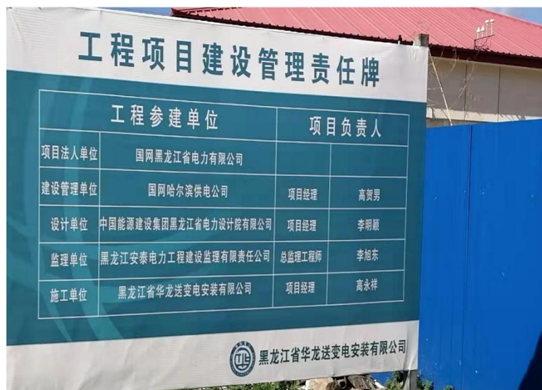
施工期告示牌及施工围挡照片