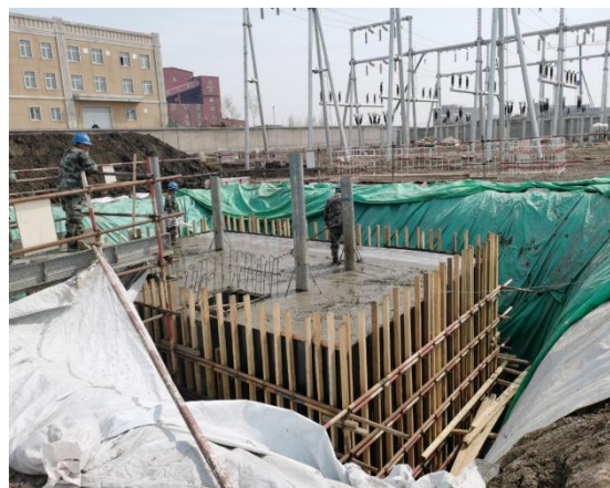
事故油池施工照片