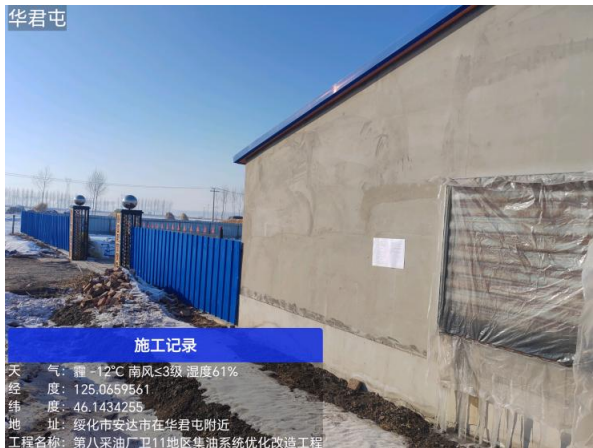
华君屯公示期照片

本次于2025年1月13日在项目周边企业、村屯张贴本工程环评报告书征求意见稿的信息公示，符合《办法》中第十一条中规定的相关要求。