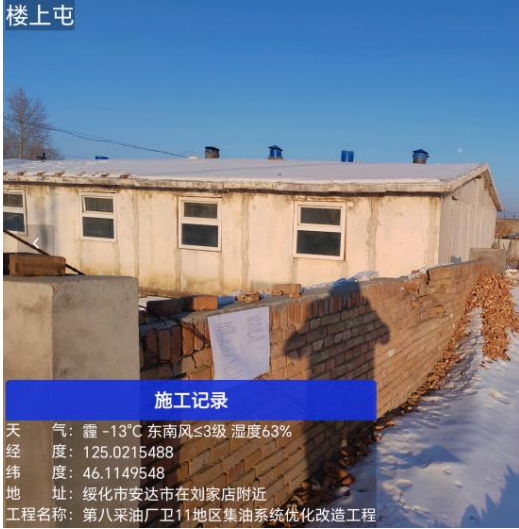
楼上屯公示期照片