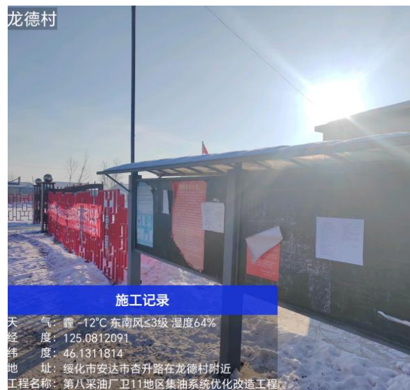
龙德村公示期照片