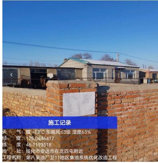
龙四屯公示期照片