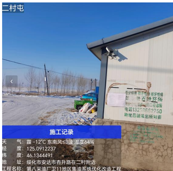
二村屯公示期照片