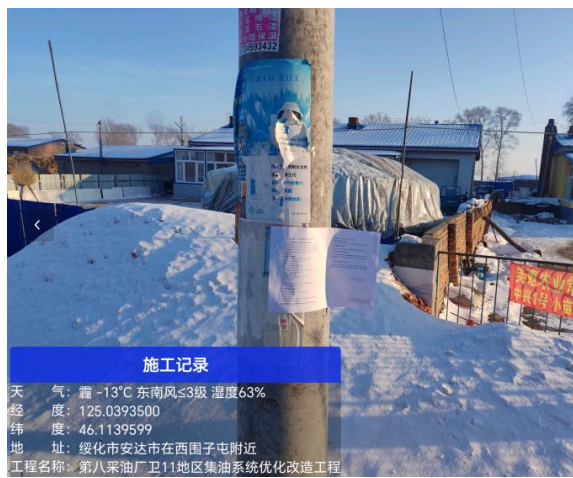
西围子屯公示期照片