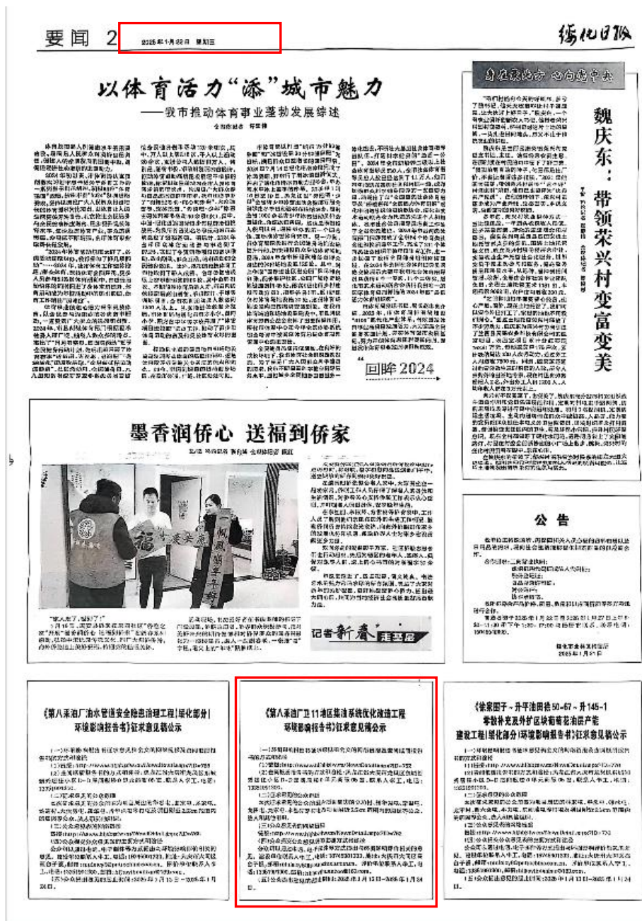
图 3-3 报纸公示截图（2025 年 1 月 22 日）

本项目于 2025 年 1 月 22 日、1 月 23 日两次通过项目所在地发行的报纸《绥化日报》进行了报纸公示，符合《办法》中第十一条的相关要求，截图如下。