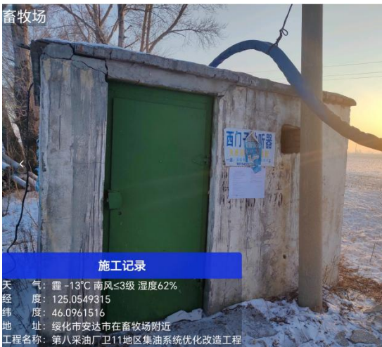
畜牧场公示期照片