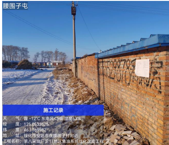
腰围子屯公示期照片