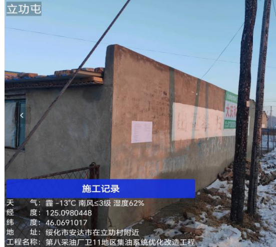
立功屯公示期照片