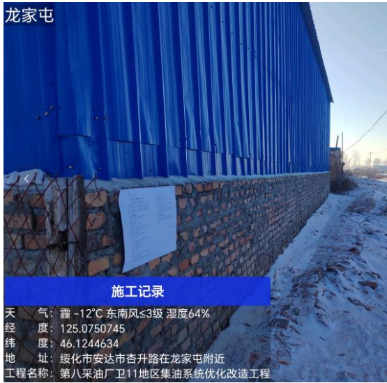
龙家屯公示期照片