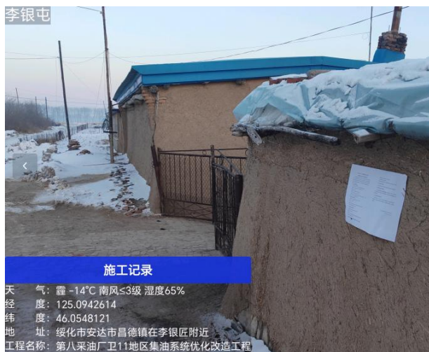
李银匠屯公示期照片