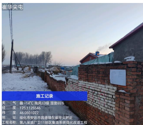
崔华尖屯公示期照片