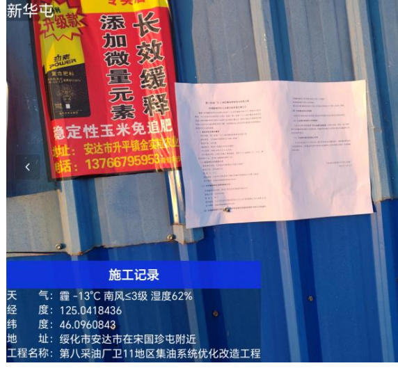
新华屯公示期照片