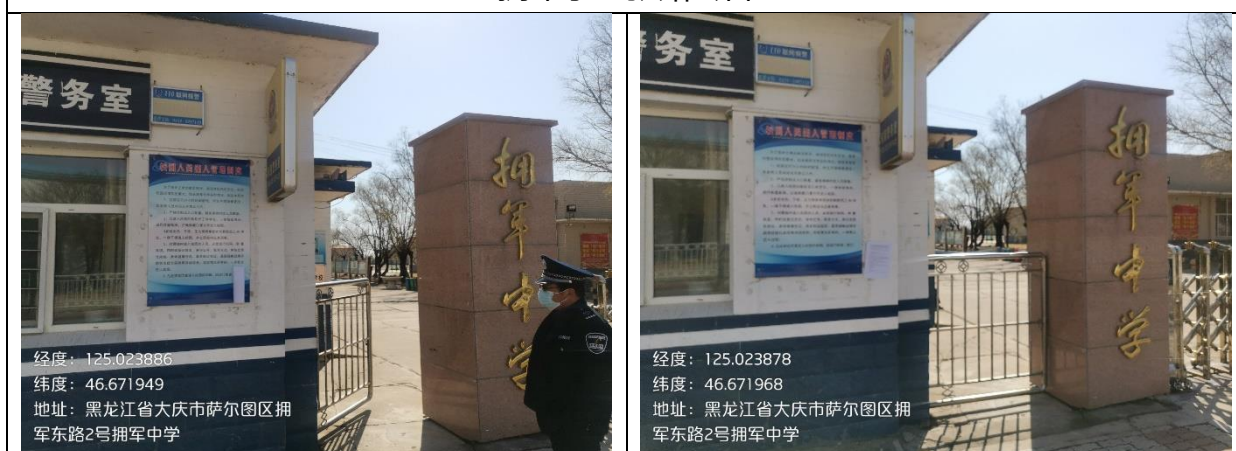
拥军中学张贴公告