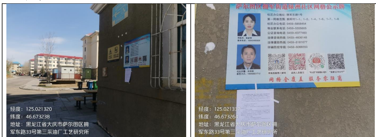
拥军小区张贴公告