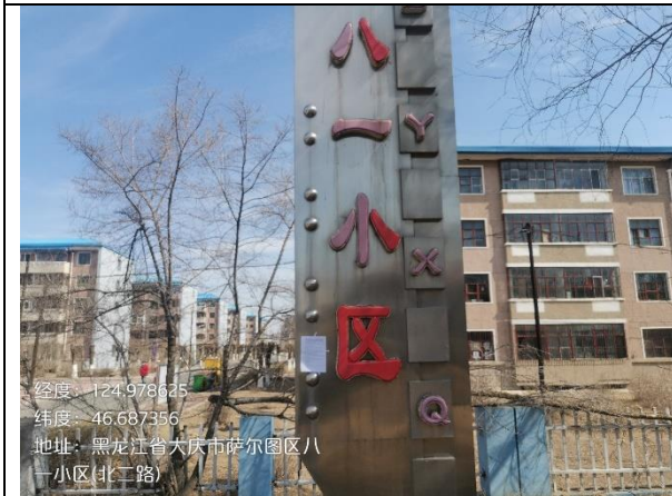
脑血管医院张贴公告

经度: 124.978625 纬度: 46.687356 地址: 黑龙江省大庆市萨尔图区八一小区(北二路)